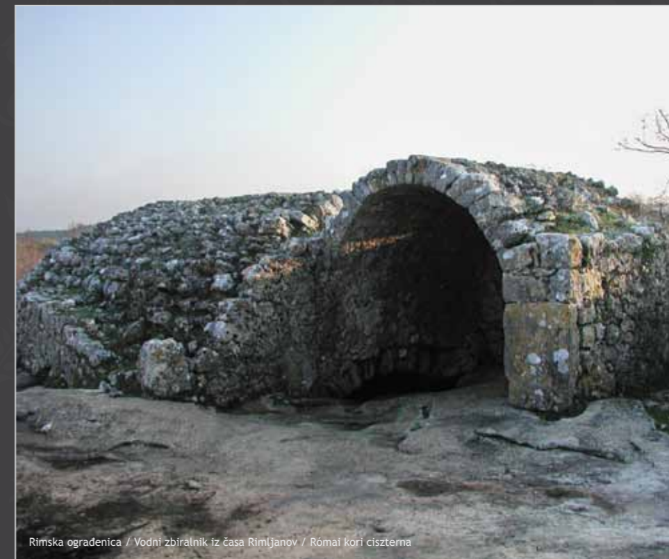
Rimska ogradenica / Vodni zbiralnik iz časa Rimljanov / Római kori ciszterna

Danju mirno turistično središče nudi možnost posjeta izložbama, galerijama, arheološkim nalazištima, a noću se pretvara u veliku, glasnu i šarenu pozornicu.